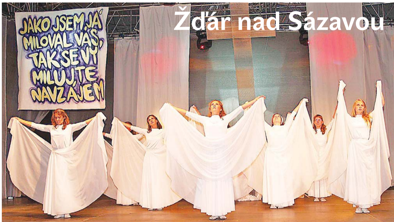
Ani ve Žďáru nebudou během programu chybět umělecká vystoupení.