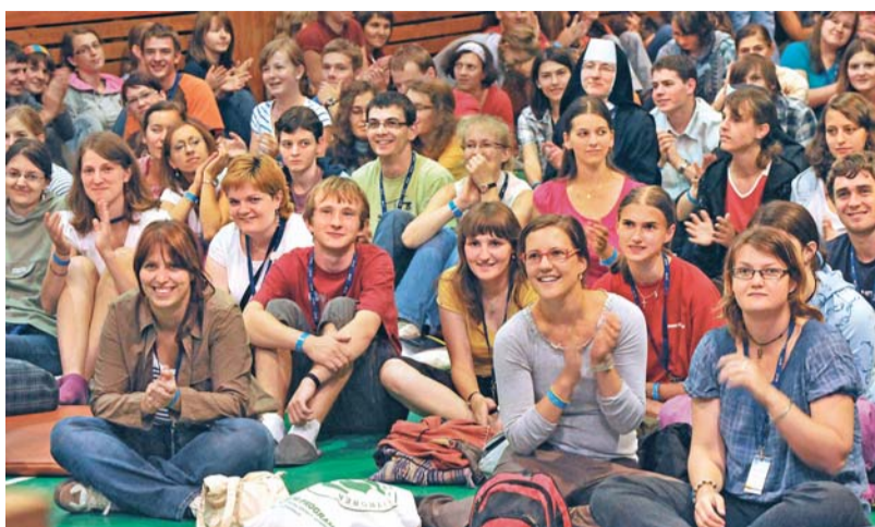
Díky dárcům se na setkání může vypravit i řada mladých lidí, kteří by tuto možnost jinak neměli.

Mladí účastníci mohou ještě zvážit případné zapojení do některého z přípravných týmů.