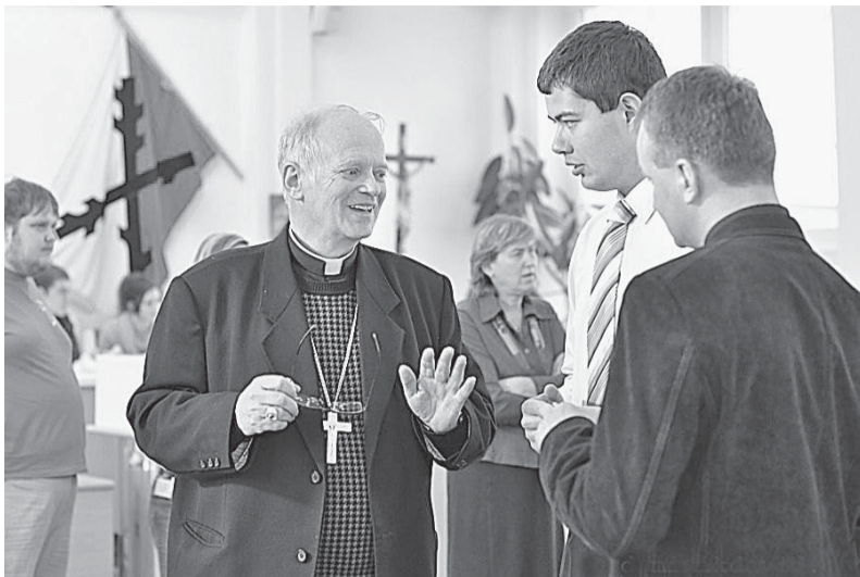
Svůj čas věnoval mládeži i biskup František Václav Lobkowicz.

V České republice se fóra konají na diecézní a celostátní úrovni už od roku 1999.