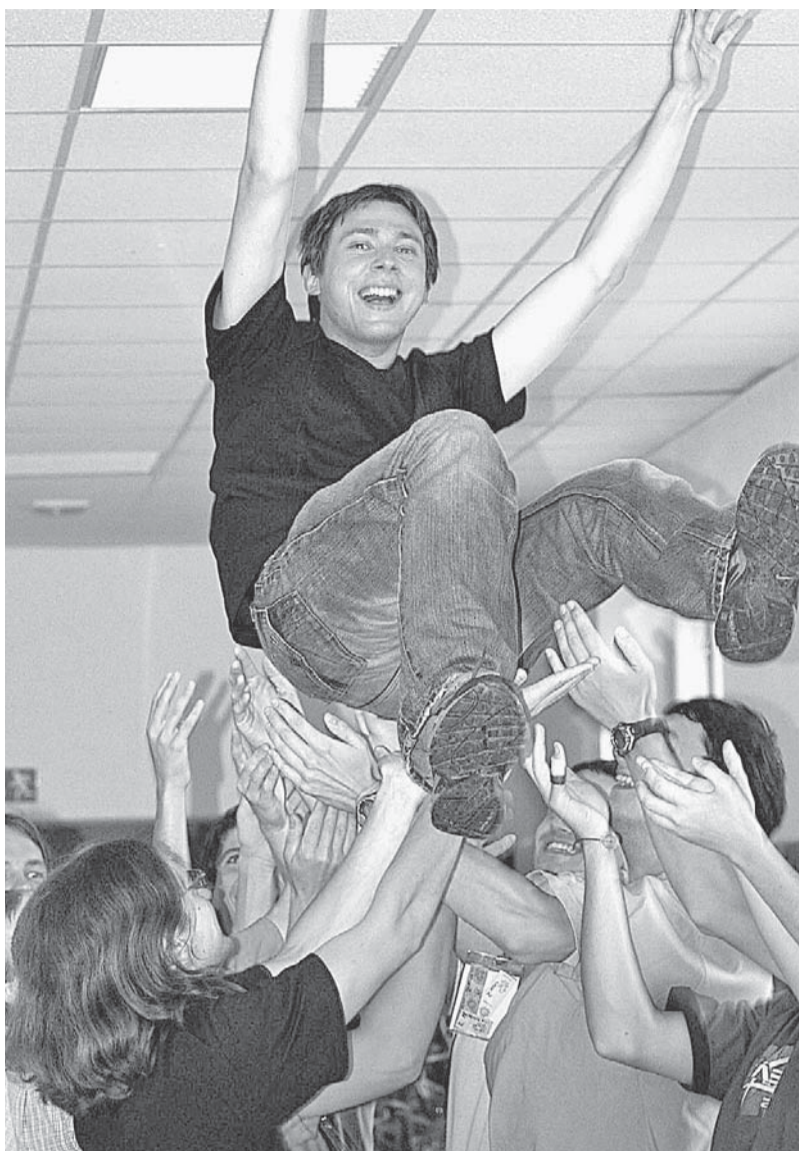
V pracovních skupinách zbyde vždy místo i pro legraci.

Rukodělné volnočasové aktivity má na starosti tým DÍLNY. Sportovní program bývá již tradičně zajištěn ve spolupráci s tělovýchovnou jednotou OREL. Skupinka PRESS vydává tiskové zprávy, stará se o medializaci akce, pro účastníky připravuje každodenní noviny. Na mediální podpoře setkání se podílejí rovněž časopisy Tarsicius, IN!, komunitní křesťanský web signály.cz, ADV Studio