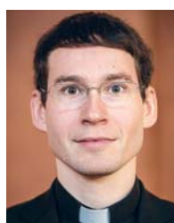
Milan Werl Primice v neděli 27. června ve 14.00 v Brně-Obřanech.

Kněžské svěcení v sobotu 19. června od 9.00 v katedrále sv. Petra a Pavla v Brně.